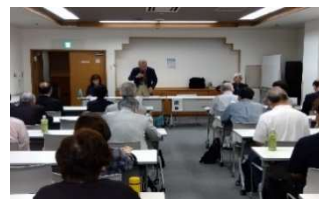
↑前会長挨拶 ~新会長挨拶↓