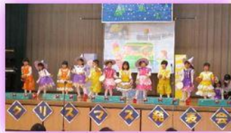
ぶどう組おもちゃのくにのものがたり