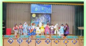
めろん組あらじんとまほうのランプ