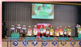
みかん組ぼんたのじどうはんばいき