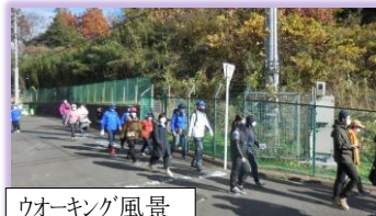
ウォーキング風景