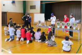
ビンゴゲームに夢中 大いに楽しみました

青少年居場所作りの12月イベントは例年クリスマスケーキ作りです。しかしコロナ禍のなか、昨年同様今年もビンゴ大会に切り替えました。感染が少し落ち着いたせいも例年以上の118名の参加と想定を大きく超えましたが、4班に分け密にならないようビンゴゲームを楽しみました。待つ間にペタング、コマ廻しで遊んだり、サンタさんからお菓子をもらったり、誕生月の子供には記念写真撮影と、わずかな時間でしたが大いに楽しんでもらいました。(緑園青少年居場所作り協議会代表・田村靖志)