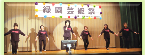
ステージ上の熱演!!

緑園シニアクラブ連合会は、去る11月27日(日)緑園地域交流センターにおいて、第2回緑園芸能祭を開催した。当地はもとより近隣の方も併せ110人・組もが登壇し、カラオケやベリーダンスなどと日頃の練習成果を次々と披露、出演者と応援者のコラボレーションにプロ歌手のご披露も加わり、200余名の観客ともども大いに盛り上がっていた。参加者は、地域の高齢者が主体で福祉活動の一環であり、仲間づくりとしても有意義であった。