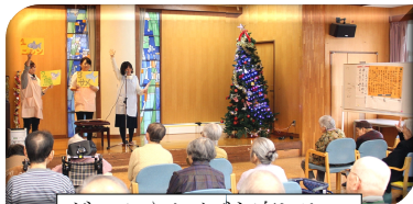
ゲームやクイズを楽しみ!