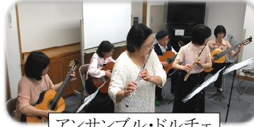
アンサンブル・ドルチェ