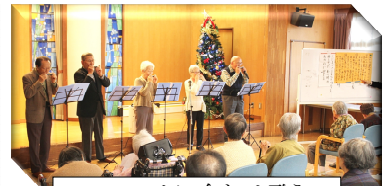
ハーモニカに合わせて歌う!!