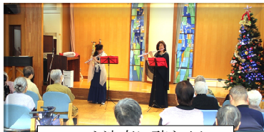
フルート演奏に聴き入り!