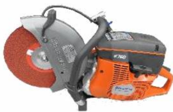
【エンジンカッター】

ただし、操作中にエンジンカッターの刃が金属に接触すると、火花が発生するため、活動場所付近に危険物（ガス、ガソリン等）が流出している状況では使用できません。