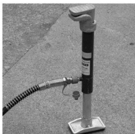
【ラムシリンダー 拡張能力 2t】