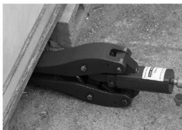
【スプレッドラム 拡張能力 1t】