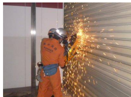
【金属を切断している様子】