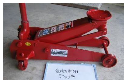
【ガレージジャッキ 持上能力 1.5t】