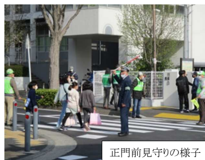
正門前見守りの様子