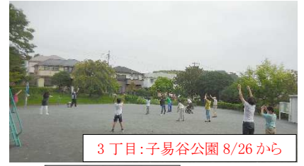
3丁目:子易谷公園 8/26から