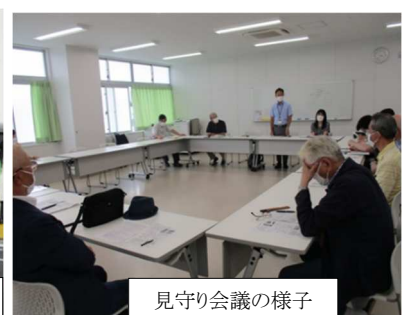
見守り会議の様子