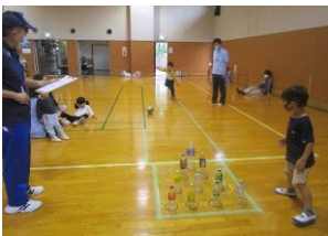
ペットボトルボウリング